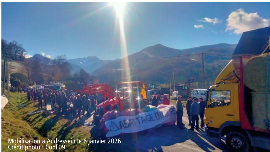
Mobilisation à Audressein le 6 janvier 2026